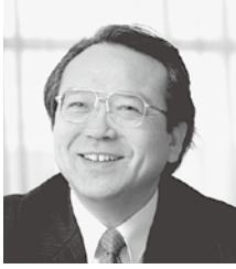
EUインスティテュート関西 諮問委員会議長