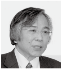
EUインスティテュート関西 代表

世界における EU の重要性は益々高まっており、この傾向は続くと考えられます。今後も EU インスティテュート関西が様々な活動を通じ、関西地域のみならず全国において EU の知名度を高めることを通じ、日・EU 関係の強化に向け、さらなる貢献を行いたいと存じます。