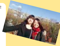
パリの Gare de Lyon 近くの公園

大学での授業はもちろん、日常から様々なことを学べるのが留学の良い所だと日々実感しています。特にここパリは、移民を含め多種多様な人々が暮らしていて、今まで座学で学んでいたことが、身近な問題であると肌で感じることができます。他の国からの留学生や現地の学生との交流も非常に刺激的です。