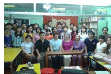
(ミャンマーでのインターンシップ)