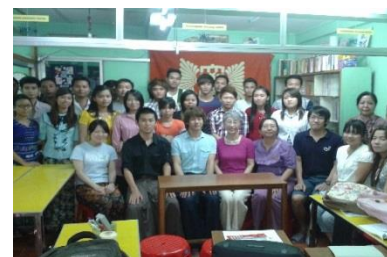
Internship in Myanmar