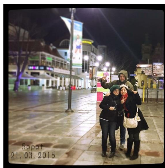
ニコラウス・コペルニクス大学の友人達と