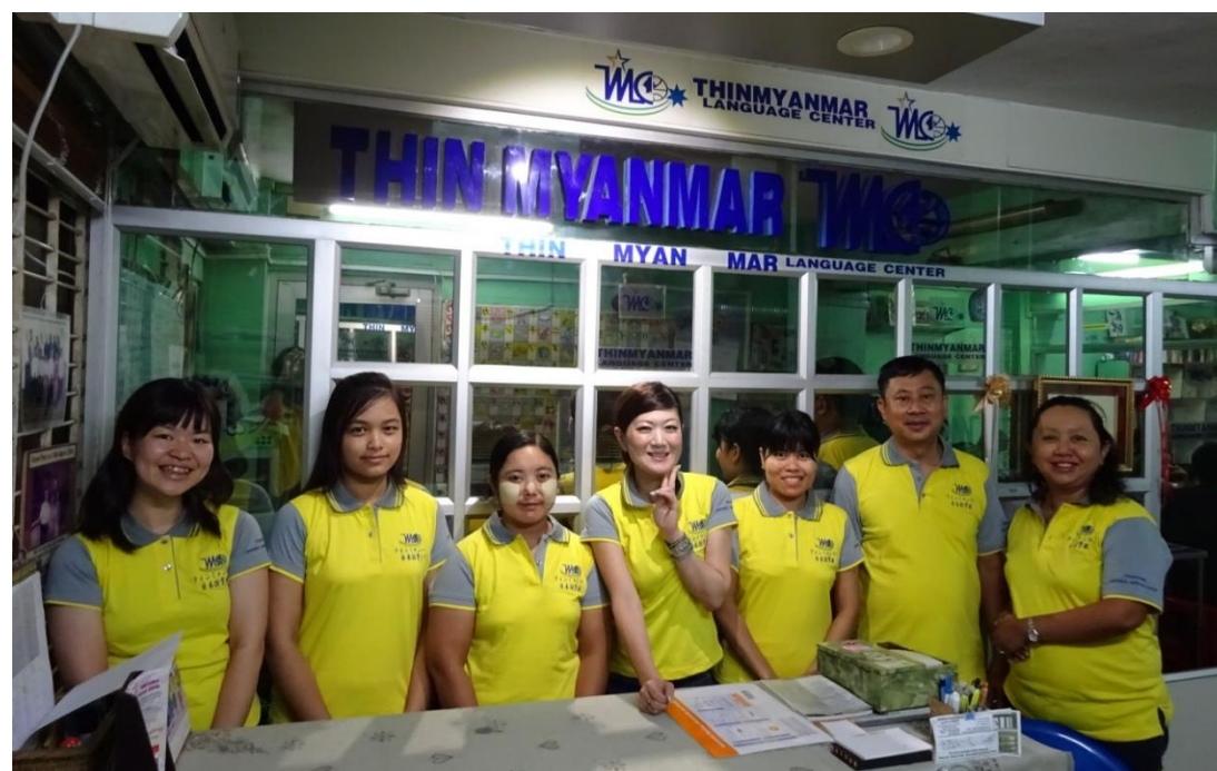
受付にてセンターのスタッフの方々と